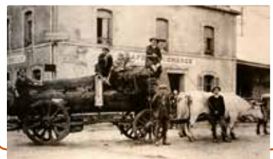
Galvachers au travail

Autour des objets, des portraits et des paroles de galvachers, on y évoque la vie rurale en Morvan, les rapports de l'homme à l'animal, le début de l'exode rural, mais aussi les temps de fête qui marquaient le départ et le retour de ces charretiers et qui rythmaient la vie de nombreux villages du Morvan central et du Haut-Morvan.