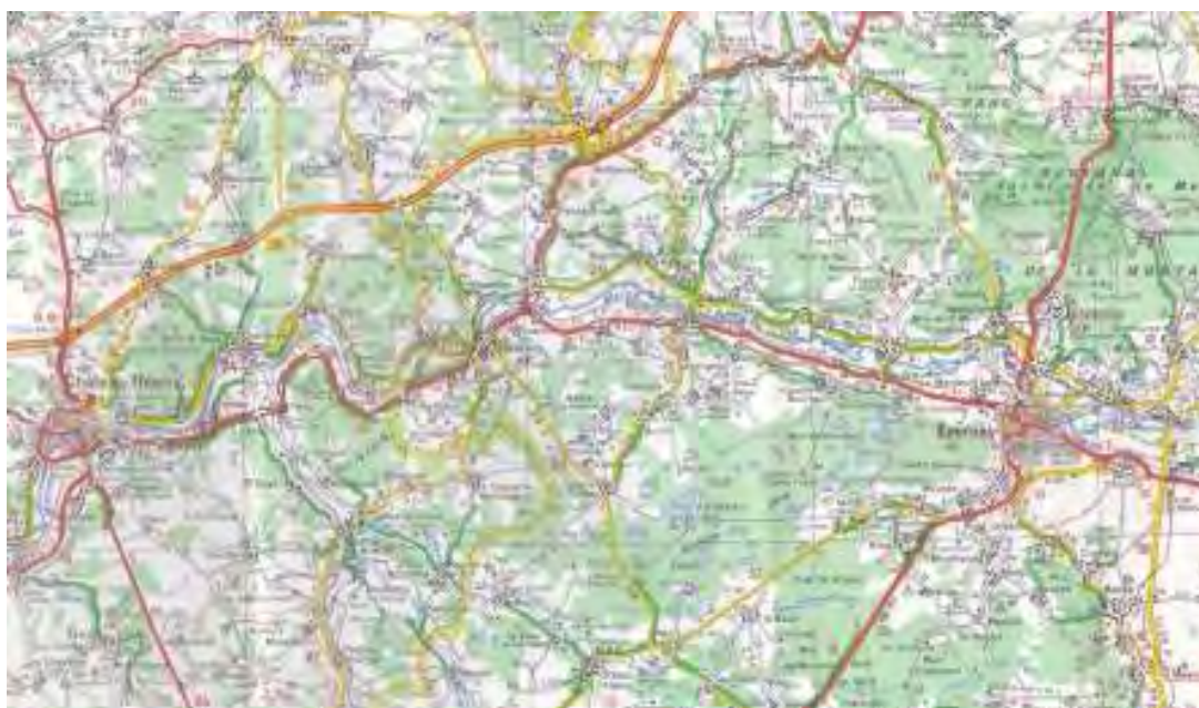
La vallée de la Marne

De nombreux actes de mariage ont été relevés ; les voituriers du Morvan ont fait souche et leurs noms de famille restent aujourd'hui bien présents.